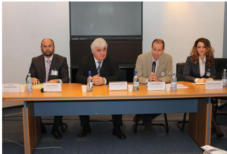
Seminar PCER, Iasi, oct. 2010