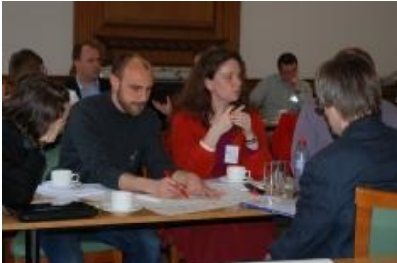
Workshop Interstrat, Edinburgh, aprilie 2011