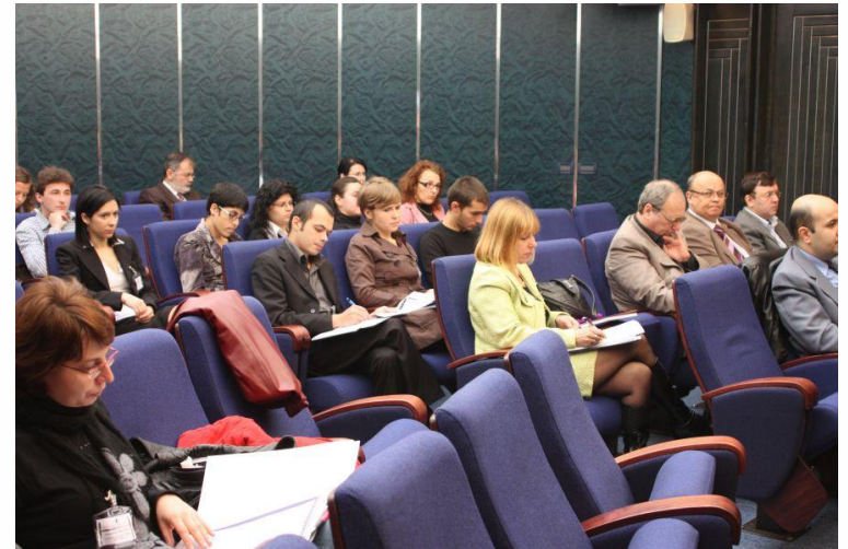
Seminar PCER, Iasi, oct. 2010